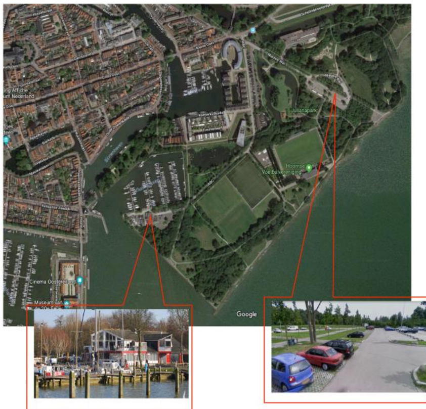
Clubhouse WSV Hoorn